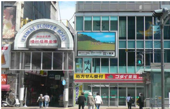
1号機大手前通り側