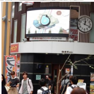
2号機みゆき通り側